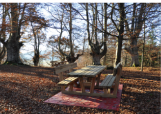
ALREDEDORES DE JUGATXI INGURUA

Gehien markatuta dagoen bidezidorretik jarraitu beharra dago Jugatxi baselizara heldu arte. Baseliza eder horren eskuinean dagoen pista markatuak Jugoraino eramango gaitu. Zementuzko bidera heltzean Jugon gaudela eskuinera egin behar dugu eta eleizara heldu aurretik berriz eskuineko bidetik, baso aldera doana, Jugoko azken baserrietako bat ezkerrean utzita.