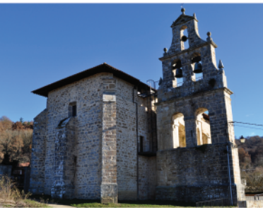
IGLESIA SAN MARTIN ELIZA

Se continúa por el camino paralelo a las fincas dejando los cruces que salen a la derecha, hasta llegar a una bifurcación donde se toma el camino de la derecha que nos acerca hasta el calero. Desde ahí se sigue por la carretera hacia la izquierda para llegar a la plaza.